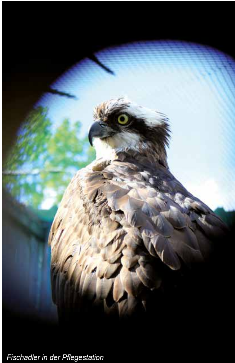
Fischadler in der Pflegestation