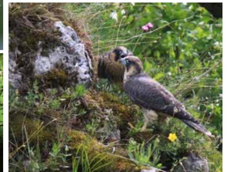
Erfolgreich versorgt: Junge Bachstelzen, Grauschnäpper und Turmfalken (von oben) waren nur einige der Pfleglinge, die erfolgreich aufgezogen und dann ausgewildert werden konnten.